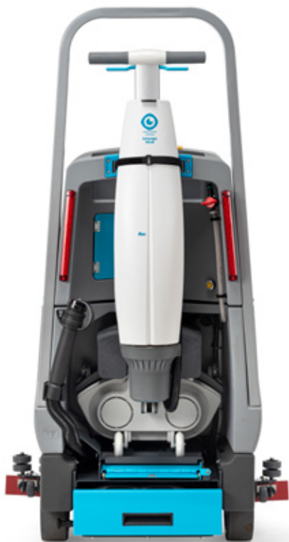
i-drive + imop Lite