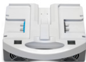
i-charge 9 (3 pezzi)